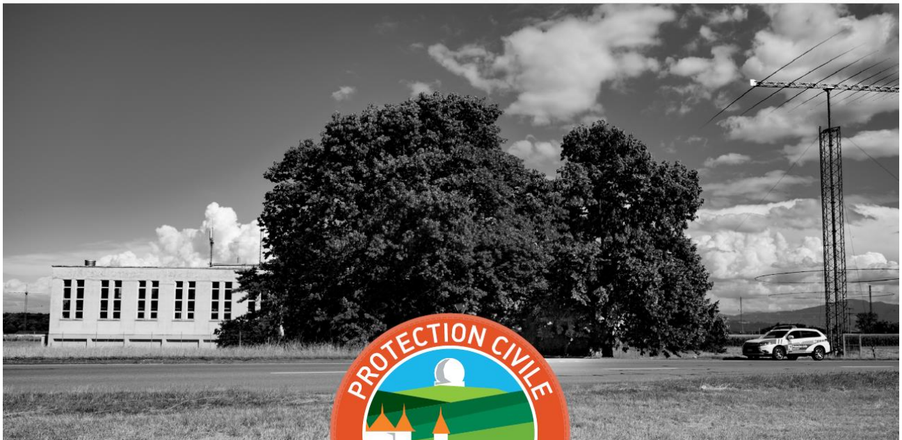
ORPC District Nyon Rte de l'Etraz 120, 1197 Prangins